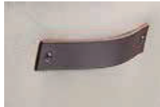
背もたれ上部裏面