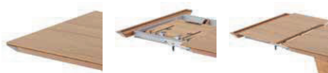
TABLE TOP & FRAME テーブル天板とフレーム

機能テーブル1EXと1DXは、天板全体をスライドさせ伸長式の片面を引き出し収納されている天板をセットする事で天板のサイズが幅50cm拡大します。